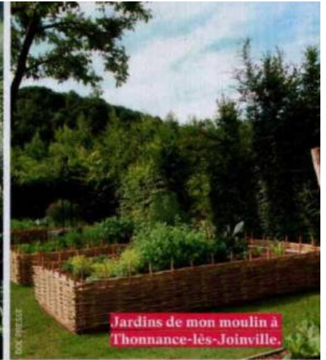
Jardins de mon moulin à Thonnance-lès-Joinville.