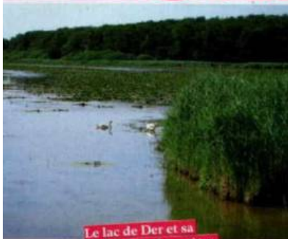
Le lac de Der et sa végétation champêtre.